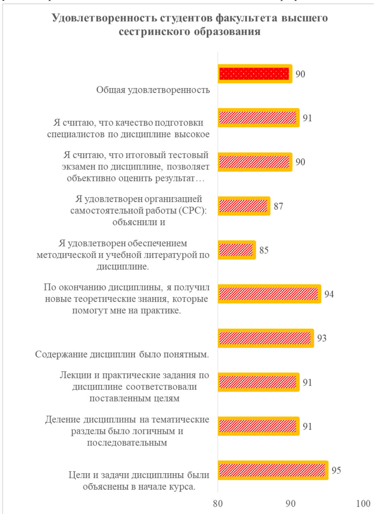
Рис. 1. Результаты оценки удовлетворенности студентов факультета ВСО КГМА им. И.К. Ахунбаева качеством учебных программ

90% опрошенных студентов удовлетворены итоговым контролем знаний и считают, что его объективным и прозрачным. Также, отмечена высокая удовлетворенность качеством подготовки специалистов на факультете.